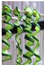
らせん状に切り干す“雷干し”

好みの形に切り、ザルや網に乗せて日当たりと風通しのよい場所で半日ほど干します。旨みが凝縮し、調味料が染みやすくなります。いつも通りの味付けでも一味違うかも。コリコリ食感です。